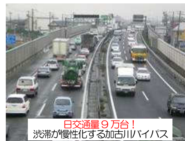
日交通量9万台！ 渋滞が慢性化する加古川バイパス