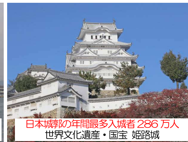
日本城郭の年間最多入城者286万人 世界文化遺産・国宝 姫路城