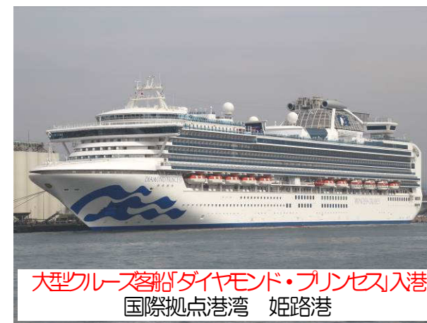
大型クルーズ客船ダイヤモンド・プリンセス入港 国際拠点港湾 姫路港