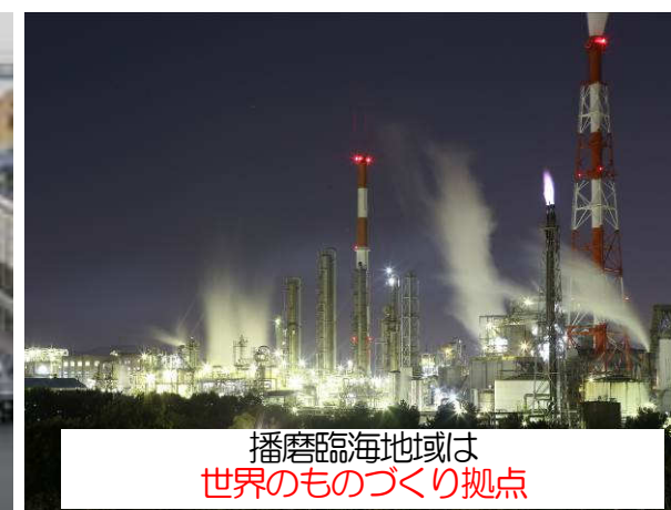
播磨臨海地域は 世界のものづくり拠点