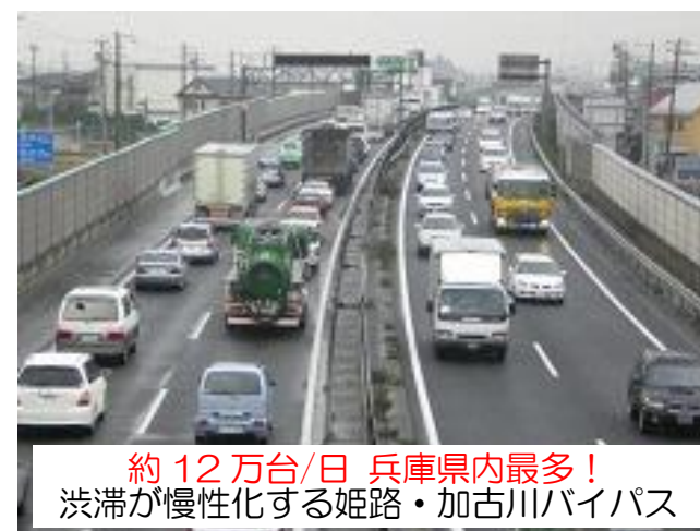
約 12 万台/日 兵庫県内最多！ 渋滞が慢性化する姫路・加古川バイパス