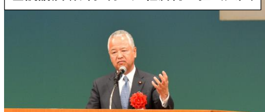
播磨は日本のものづくりの拠点であるが、ポテンシャルを発揮するには道路等のインフラ整備が必要！