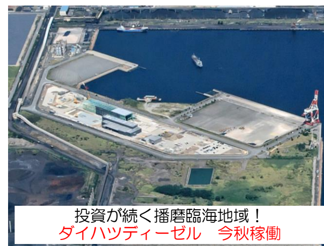
投資が続く播磨臨海地域！ ダイハツディーゼル 今秋稼働