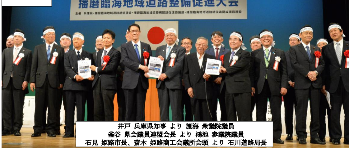
井戸 兵庫県知事 より 渡海 衆議院議員 釜谷 県会議員連盟会長 より 鴻池 参議院議員 石見 姫路市長、齋木 姫路商工会議所会頭 より 石川道路局長