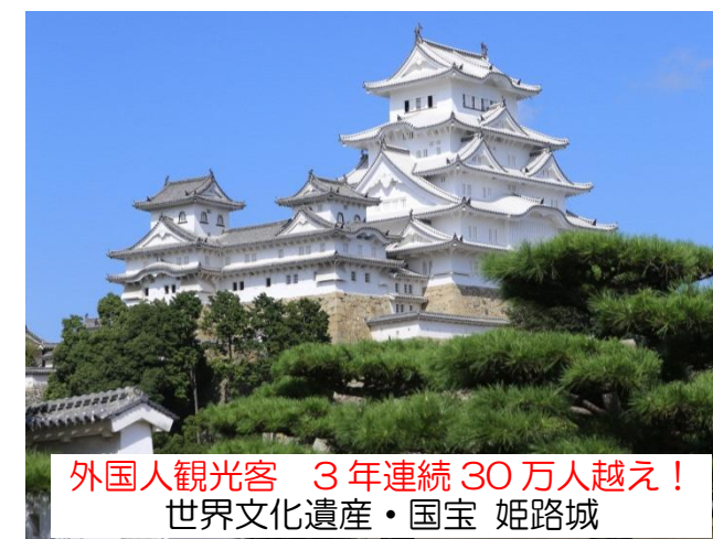
外国人観光客 3年連続 30万人越え！ 世界文化遺産・国宝 姫路城