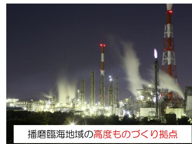
播磨臨海地域の高度ものづくり拠点